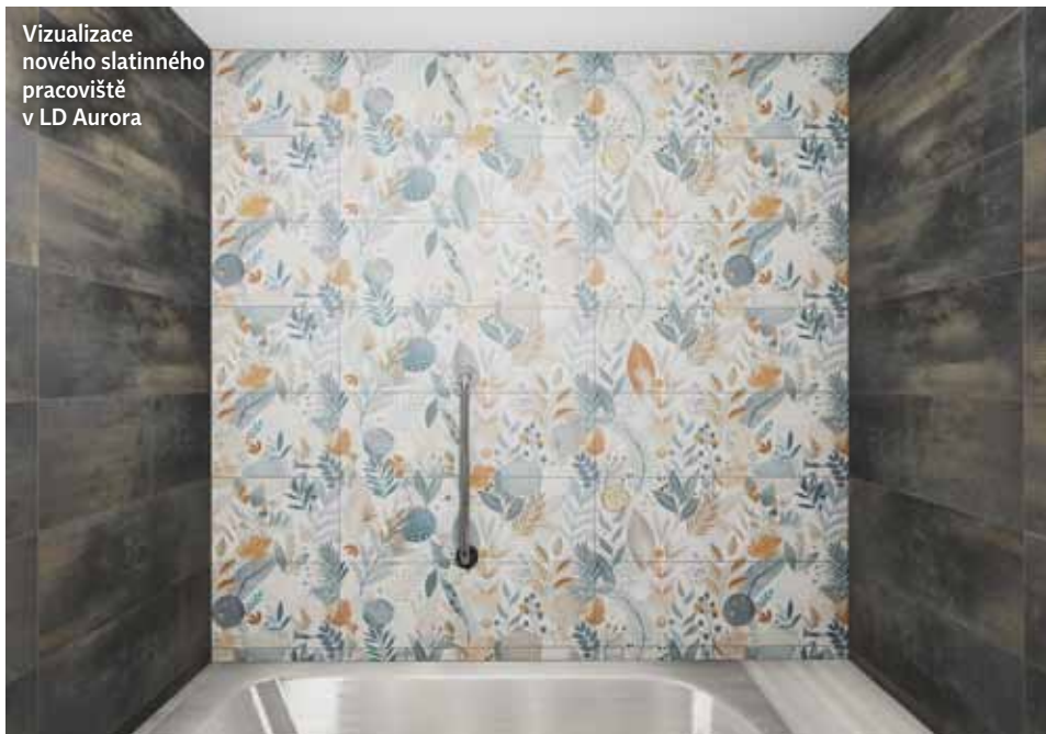
Vizualizace nového slatinného pracoviště v LD Aurora

slatinnou koupel a masáž pro všechny zájemce. Doporučuji vyzkoušet také některou ze služeb našeho fyziocentra, kde jsou zajímavé přístroje a rozsáhlá nabídka masáží, z níž si vybere skutečně každý. Pro lidi, kteří jsou ve volném čase aktivní, je vhodná návštěva fitness, saunového světa nebo v závislosti na sezoně a počasí venkovní vodní svět či vnitřní bazény. Pro milovníky dobrého jídla jsou k dispozici naše lázeňské restaurace, Adéla v Lázeňském domě Berta a restaurace Harmonie v areálu Lázeňského domu Aurora. Máme také bowling bary, provozujeme kino a pro naše klienty připravujeme i kulturní program. Několik novinek se v roce 2026 objevuje i mezi pobyty. Úspěšný balíček roku 2025 „Jak na bolavá záda“ letos nabízíme i v Lázeňském domě Berta. Z novinek mezi