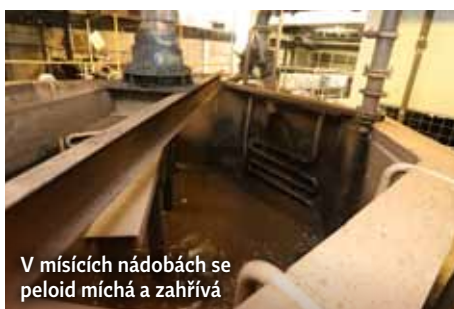
V mísících nádobách se peloid míchá a zahřívá