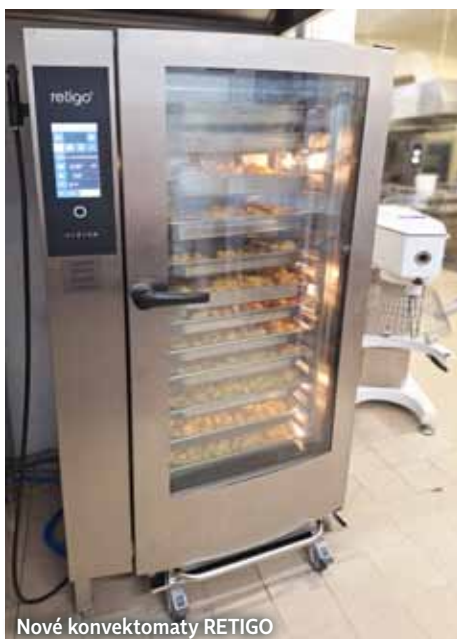
Nové konvektomaty RETIGO