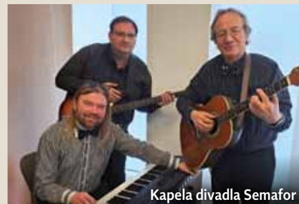
Kapela divadla Semafor

Květnové Třeboňské lázeňské matiné v neděli 17. května v 11.00 hodin ve Společenském sále LD Aurora bude vzpomínkou na slavné písně divadla SEMAFOR autorů Ji-