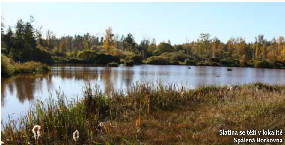
Slatina se těží v lokalitě Spálená Borkovna

Slatinné koupele i slatinné zábaly jsou využívány při léčebných pobytech v obou lázeňských domech. Indikací slatinných koupelí, resp. zábalů, jsou téměř všechna běžná onemocnění pohybového aparátu, například artritida, artrózy, bolestivé syndromy páteře