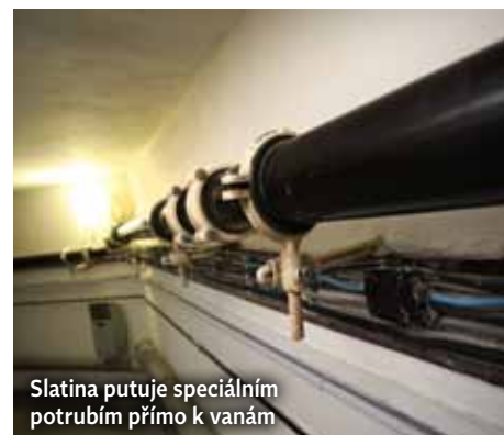
Slatina putuje speciálním potrubím přímo k vanám

Slatinový zábal a slatinnou koupel 38 °C lze v třeboňských lázních absolvovat pouze na základě lékařského předpisu. Slatinou koupel o teplotě 37 °C a peloidokinezioterapii lze zakoupit i bez lékařského předpisu. Přestože jsou peloidní procedury velmi oblíbené, jsou náročné pro organismus, a proto musí lékař vždy předem posoudit vhodnost či nevhodnost koupele teplejší než 37 °C z hlediska zdravotního stavu konkrétního pacienta. <