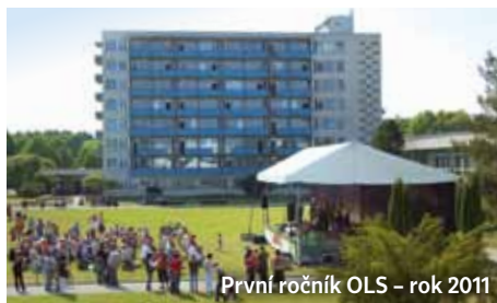
První ročník OLS – rok 2011

Bohužel, letos poprvé nebude ohňostroj. Velice nás to mrzí, ale jako lázeňské zařízení spadáme do režimu zdravotnického provozu a platná legislativa nám v jeho blízkosti pořádání ohňostrojů neumožňuje. I přesto na vás čeká krásný a na kulturu a zážitky bohatý den, tak jej prožijte s námi.