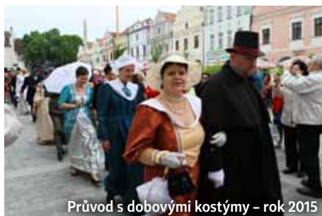
Průvod s dobovými kostýmy – rok 2015