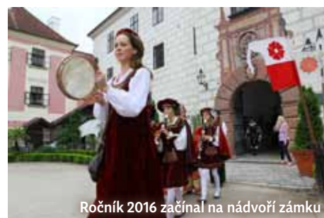
Ročník 2016 začínal na nádvoří zámku

bychom nezvládli. Ani technika nás nezradila, i když do ní napadaly litry vody.