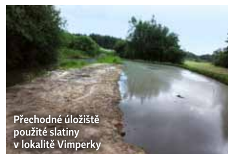
Přechodné úložiště použité slatiny v lokalitě Vimperky

i kosterních svalů a stavy po kloubních náhradách i v předoperační přípravě před plánovanou kloubní náhradou.