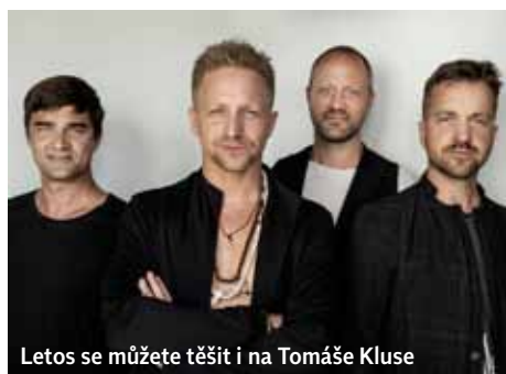
Letos se můžete těšit i na Tomáše Kluse