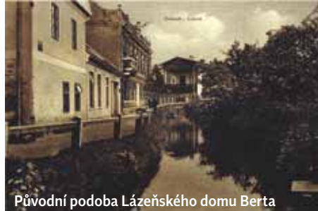
Původní podoba Lázeňského domu Berta

Lázeňský dům Berta, jeden ze dvou domů našich lázní, bude klientům zanedlouho k dispozici již 143 let. Dnem D pro otevření „Lázní“ a etapu novodobého lázeňství v Třeboni se stal 19. květen 1883. V porovnání s tím, jak vypadá lázeňský dům u Zlaté stoky dnes, se na konci 19. století jednalo o skromný baráček, který disponoval 10 pokoji s možností ubytovat 16 klientů. Lázně se v Třeboni otvíraly v době, kdy byly návštěvy podobných zařízení spíše doménou mužů. V lázních obecně se v té době léčily ženy z vyšších společenských vrstev. Služby treboňských lázní tehdy stály na koupelích. Pohybové terapie a přístrojové vybavení se do léčby zařazují až o mnoho let později. Již na konci 19. století však v budově Lázní ordinoval lékař a nacházel se v něm také byt zakladatele treboňských lázní Václava Hucka. Rodina Huckových se do nově vybudovaného domu přestěhovala krátce po úspěšné kolaudaci celého objektu, konkrétně 19. října 1882.